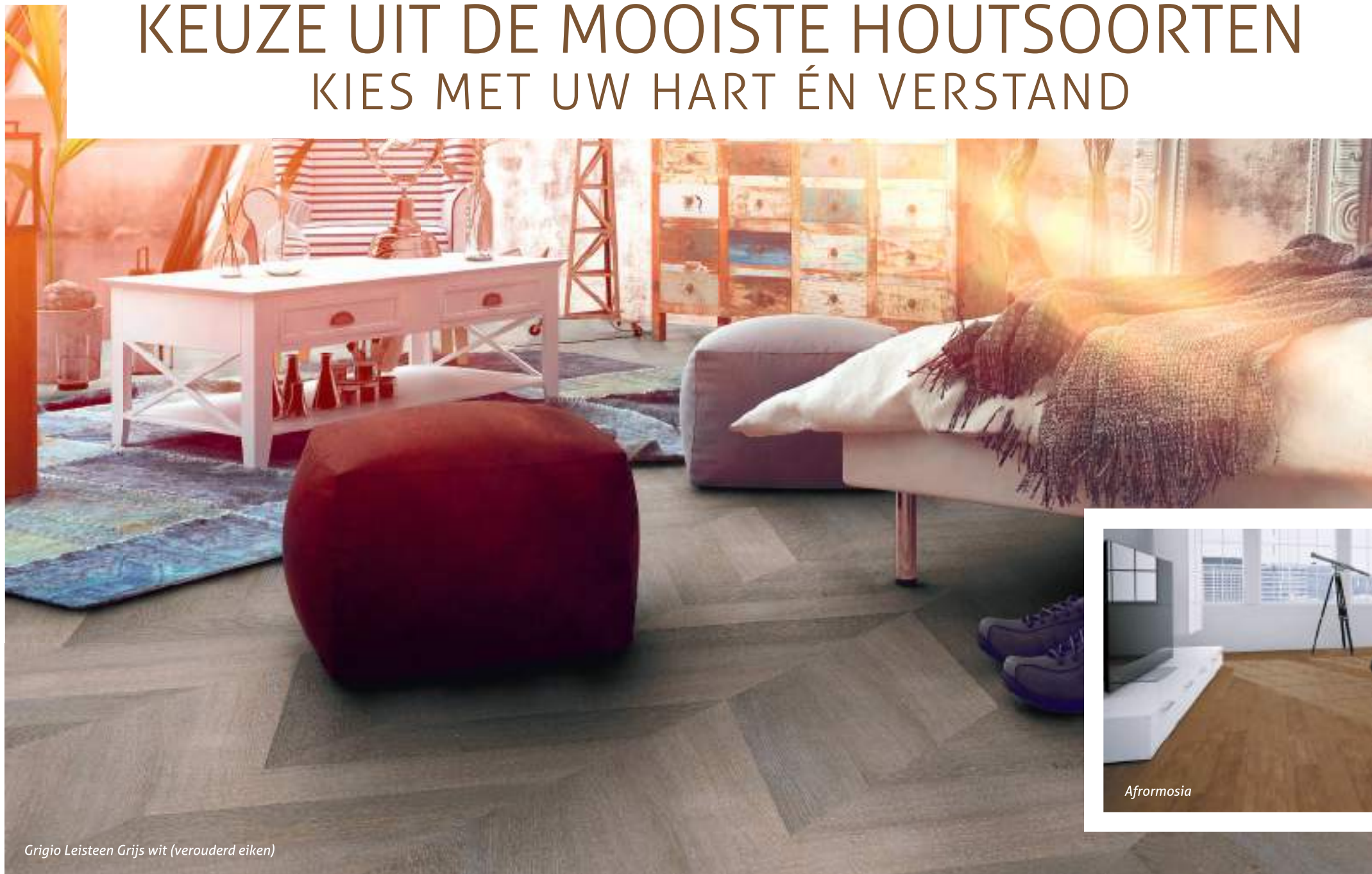
Grigio Leisteen Grijs wit (verouderd eiken)