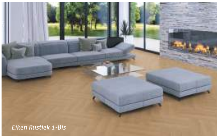
Eiken Rustiek 1-Bis